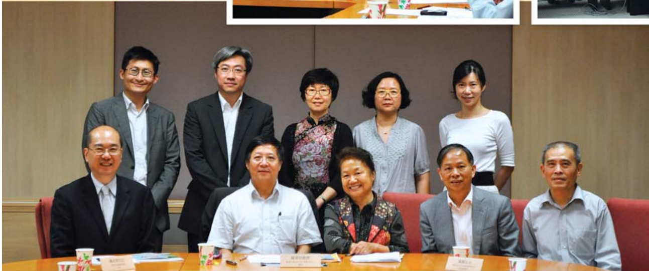
訪問團與亞太老年學研究中心團隊合影。