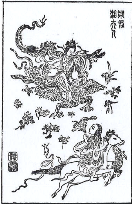
傅抱石 九歌图—湘夫人（水墨设色）