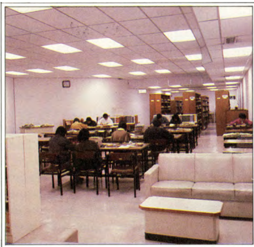
林護圖書館 The Lam Woo Library