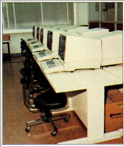
電腦中心 The Computer Centre