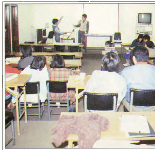
視聽中心 The Audio Visual Centre