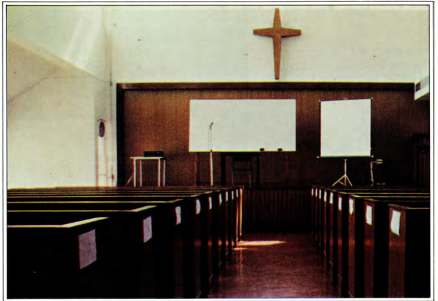
禮拜堂 The Chapel