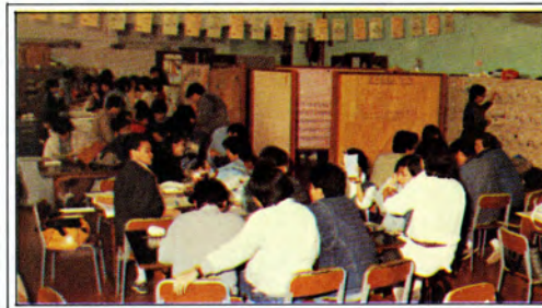
學生會一角 The Students' Union