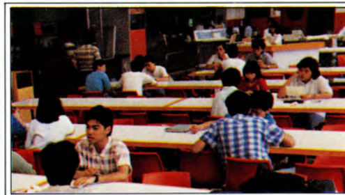
膳堂一景 The Canteen