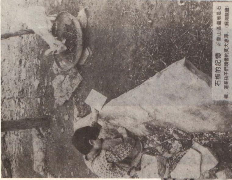
石板的記憶 沂蒙山區遭地是石板，這是孩子們讀書的莫大恩澤。