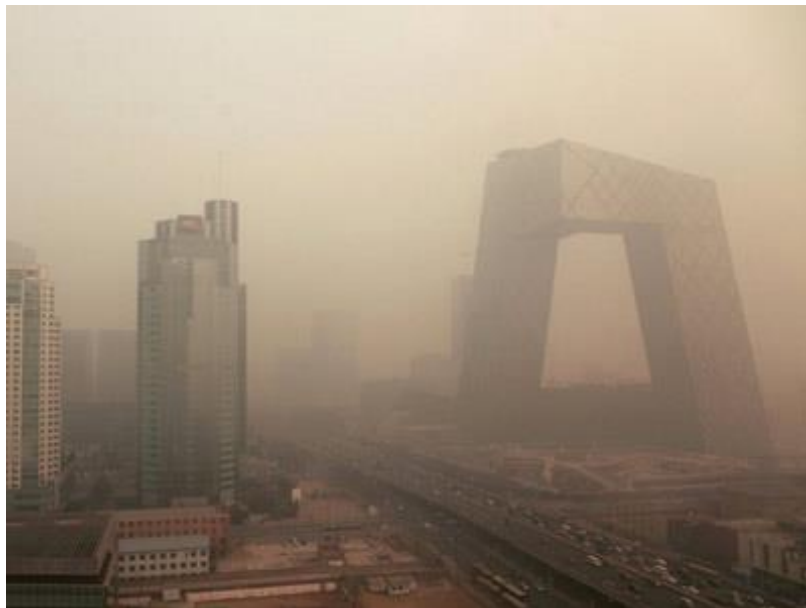
北京霧霾問題嚴重

大量的工作，這也是實事求是，是有大量資料的。可是我們也看到，作了這麼多的努力，國際談判當中作了這麼多的妥協和讓步，但是我們的生態還是在持續地惡化，霧霾持續嚴重，也就是說這是遠遠不夠的。