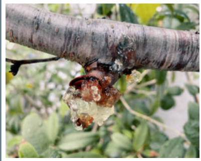
透明啫喱狀的桃膠