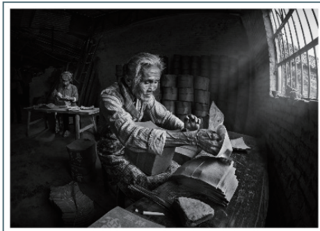
終身的奉獻

第八屆南南論壇 (SSFS8) 從2021年6月15日開始，延續到7月19日，每天有對話，或者是著名的演講者進行演講，由主持人與演講者進行對話。