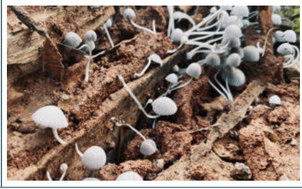
在枯木中間長出水母般的菇類