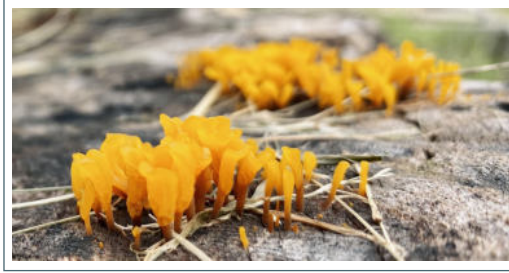
枯樹木頭上的小植物