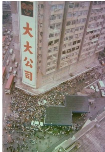
左 圖 摘 取 自