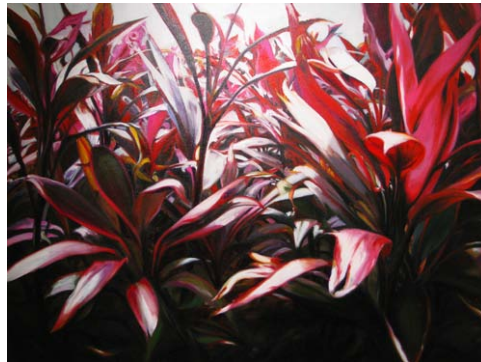
Red Leaves 劉家成作品