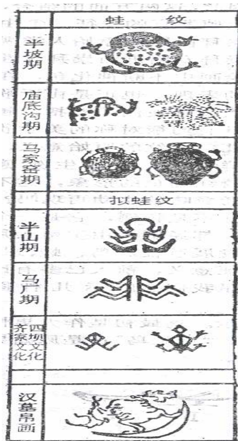
(輯自傅道彬《中國生殖崇拜文化論》，1990)

附錄一： 半坡期、廟底溝期、馬家窟期、半山期、馬廠期、齊家文化與四壩文化、 漢墓帛畫的蛙紋