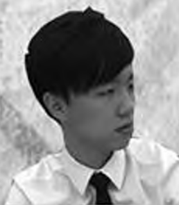
海神JJ 之旅La! 房號:204

各位年輕的探險家你地好呀! 我係今次旅途嘅海神積積。有我喺度, 你地一定可以喺呢三日兩夜嘅旅途中搵到屬於自己嘅寶物。放心享受呢次探索